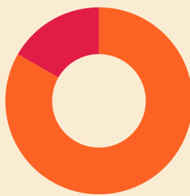
No. de regiones

* Sector privado, grupos organizados y academia.